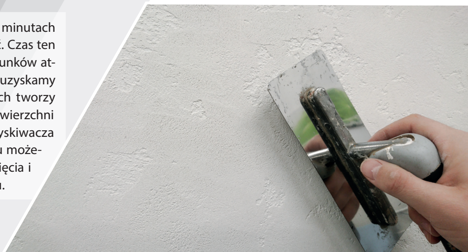
Wygładzenie powierzchni betonu

Po wstępnym odparowaniu wody, po około 40-60 minutach powierzchnię tynku należy równomiernie wygładzić. Czas ten może ulec zmianie w zależności od panujących warunków atmosferycznych. W miejscach uzyskanych „raków” uzyskamy wżery betonu, natomiast w miejscach wyrównanych tworzy się gładka powierzchnia. Dla uzyskania gładziej powierzchni żądane miejsce można skropić wodą z ręcznego spryskiwacza i wygładzić. Uzyskaną w ten sposób strukturę tynku możemy pozostawić na około 24 godziny w celu wyschnięcia i utwardzenia lub możemy wykonać imitację szalunku.