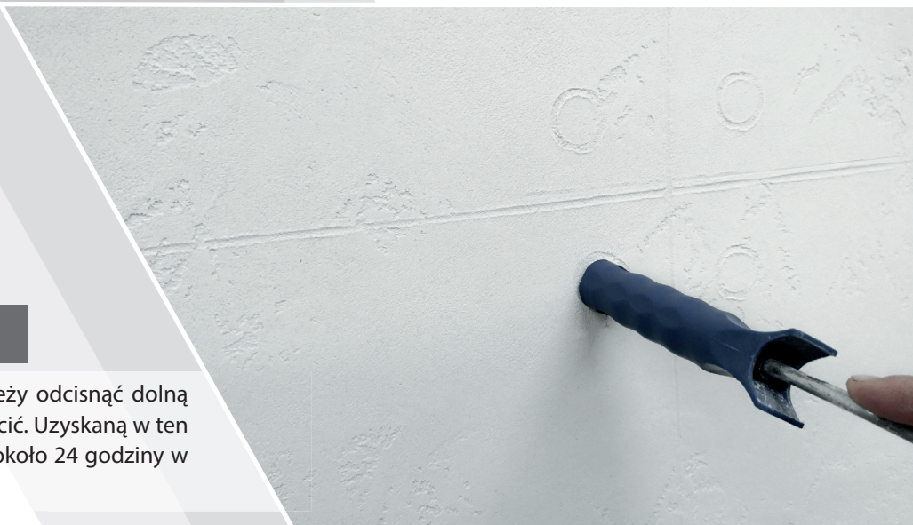
Wykonanie imitacji mocowania szalunku

Aby uzyskać imitację mocowania płyt należy odcisnąć dolną okrągłą część rączki wałka i delikatnie obrócić. Uzyskaną w ten sposób strukturę tynku pozostawiamy na około 24 godziny w celu wyschnięcia i utwardzenia.