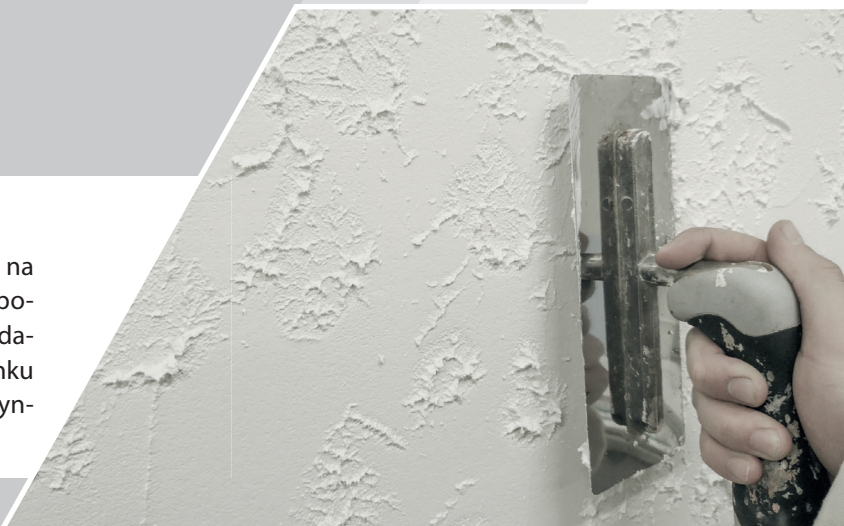
Nakładanie drugiej warstwy Mitech Artbeton

Na suchą, wyschniętą powłokę podkładową nakładamy na gładko drugą warstwę masy dekoracyjnej za pomocą za pomocą krótkiej pacy weneckiej (ze stali nisko węglowej). Żądaną strukturę należy wyprowadzić na świeżo nałożonym tynku przez prostopadłe odciąganie pacy od mokrej powierzchni tynku tworząc tzw: raki. Pozostawić na około 40 – 60 minut.