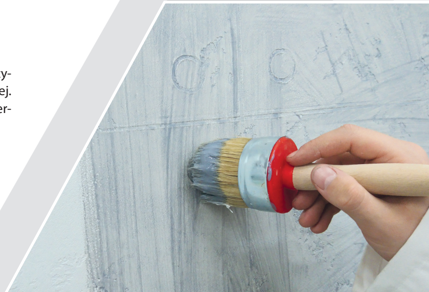
Nakładanie farby lazurującej na powierzchni masy dekoracyjnej

Po wyschnięciu drugiej warstwy betonu dekoracyjnego przystępujemy do nałożenia ostatecznej warstwy farby lazurującej. Farbę lazurującą nakładamy wałkiem lub pędzlem równomiernie na powierzchni masy dekoracyjnej.