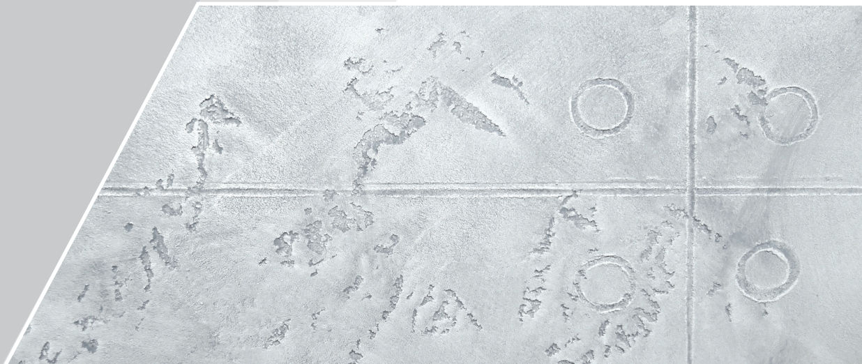
Ostateczny wygląd struktury betonu