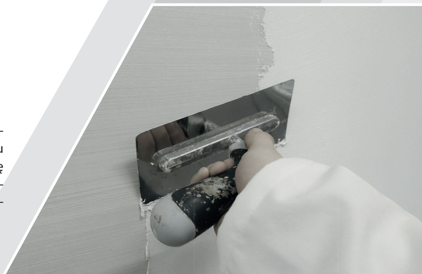
Nakładanie pierwszej warstwy Mitech Artbeton

UWAGA! MASĘ DEKORACYJNĄ NALEŻY NAKLADAĆ W DWÓCH WARSTWACH.